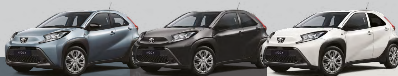
אפור תכלת מטאלי 1K3