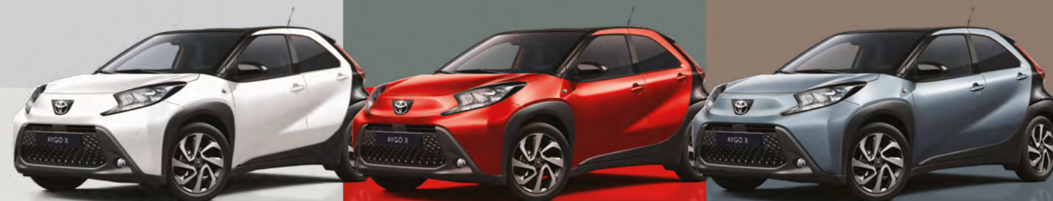
לבן צחור / גג שחור 2NR - 040/209