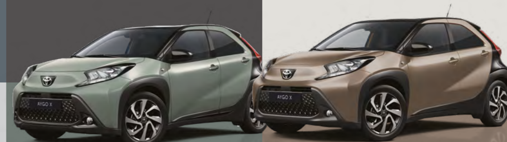
ירוק טרגון / שחור 2VN - 6X3/209