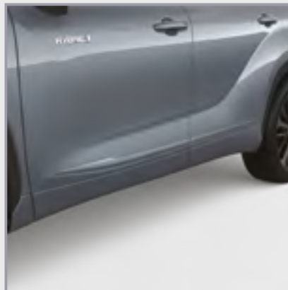
פסי הגנה לדלתות

סט פסי הגנה לדלתות בצבע הרכב המספקים שכבת הגנה לדלתות מפני שריטות ופגיעות