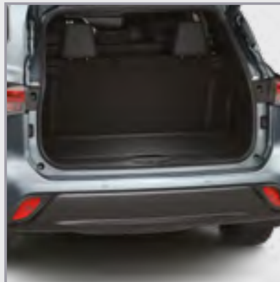
אמבטיה לתא מטען

שטיח גומי לתא מטען המספק הגנה מפני לכלוך והחלקה של ציוד וסחורה