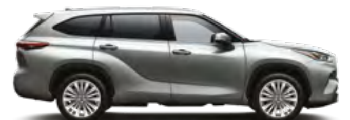
1J9 כסוף מטאלי