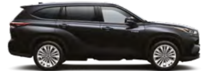
218 שחור מיקה מטאלי