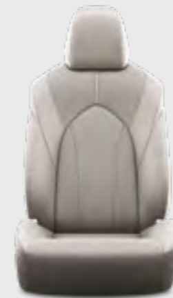
ריפוד עור בצבע אפור E-XCLUSIVE 4X4