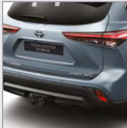
וו גרירה מקורי קבוע כולל התאמת הפגוש האחורי

וו גרירה מקורי המספק כושר גרירה גבוה המאפשר התקנה של מתקן אופניים אחורי