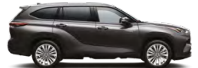
163 אפור כהה מטאלי