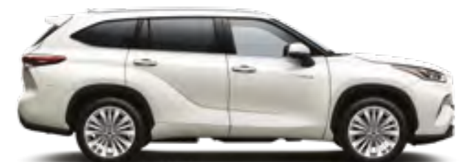
089 לבן פנינה מטאלי