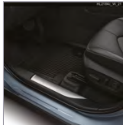
סט שטיחי גומי

שטיחי הגומי מגנים על פנים הרכב מפני לכלוך מבחוץ וניתנים להסרה לניקוי קל ופשוט