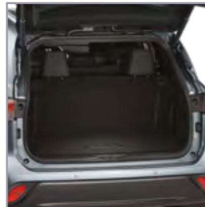
שטיח לבד לתא מטען

שטיח לבד לתא המטען המגן מפני לכלוך ומוסיף למראה האלגנטי של הרכב