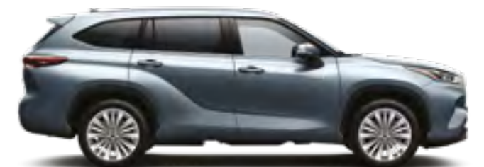
1A5 כחול טיטניום מטאלי*