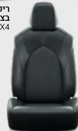
ריפוד עור בצבע שחור E-XCLUSIVE 4X4