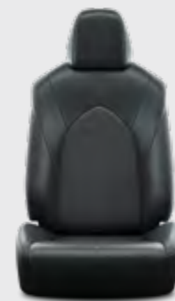
ריפוד דמוי עור בצבע שחור E-MOTION 4X4