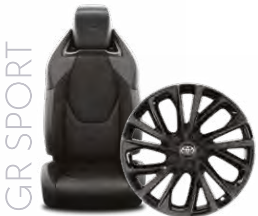
חישוקי סגסוגת קלה 19" מושבים ספורטיביים עם ריפוד זמש בשילוב עור מלאכותי בר קיימא