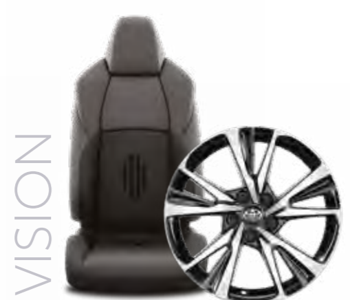
חישוקי סגסוגת קלה 18" ריפוד בד מהודר בר קיימא בצבע שחור