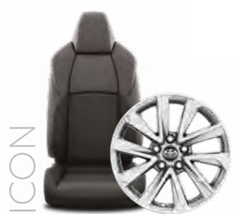
חישוקי סגסוגת קלה 17" ריפוד בד בר קיימא בצבע שחור