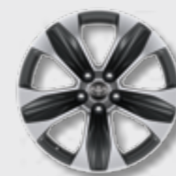
חישוקי סגסוגת קלה 18" בדגם E-MOTION 4X4 בלבד