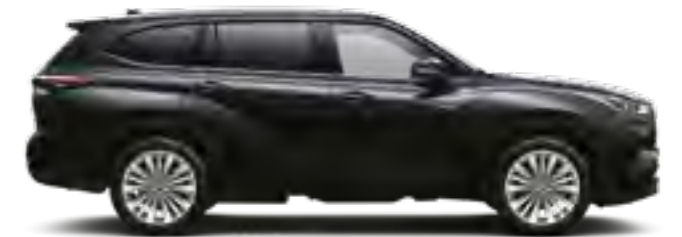
218 שחור מיקה מטאלי