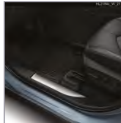
סט שטיחי גומי

שטיחי הגומי מגנים על פנים הרכב מפני לכלוך מבחוץ וניתנים להסרה לניקוי קל ופשוט