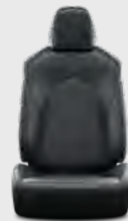
ריפוד דמוי עור בצבע שחור E-MOTION 4X4