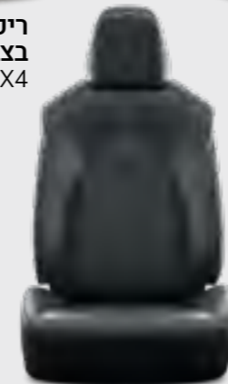
ריפוד עור בצבע שחור E-XCLUSIVE 4X4