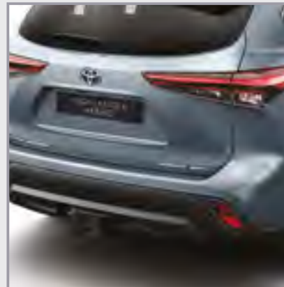
וו גרירה מקורי קבוע כולל התאמת הפגוש האחורי

וו גרירה מקורי המספק כושר גרירה גבוה המאפשר התקנה של מתקן אופניים אחורי