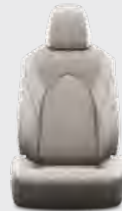
ריפוד עור בצבע אפור E-XCLUSIVE 4X4