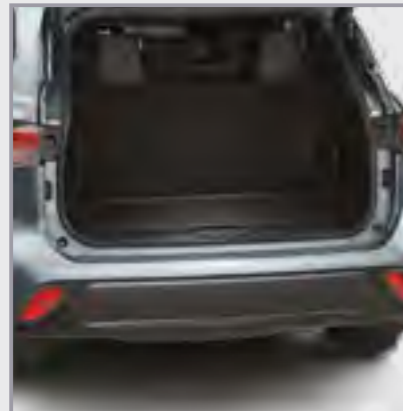
אמבטיה לתא מטען

שטיח גומי לתא מטען המספק הגנה מפני לכלוך והחלקה של ציוד וסחורה