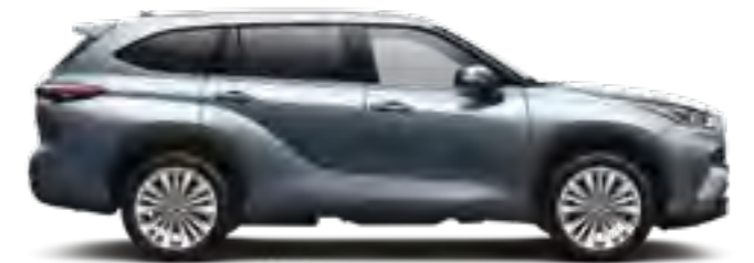
1A5 כחול טיטניום מטאלי*