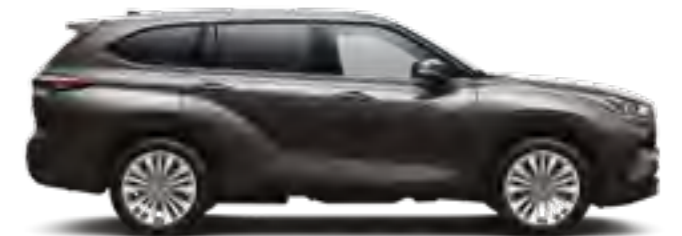
163 אפור כהה מטאלי