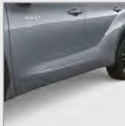
פסי הגנה לדלתות

סט פסי הגנה לדלתות בצבע הרכב המספקים שכבת הגנה לדלתות מפני שריטות ופגיעות