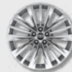
חישוקי סגסוגת קלה 20" בדגם E-XCLUSIVE 4X4 בלבד