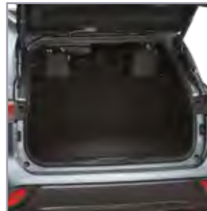
שטיח לבד לתא מטען

שטיח לבד לתא המטען המגן מפני לכלוך ומוסיף למראה האלגנטי של הרכב