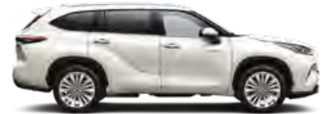
089 לבן פנינה מטאלי