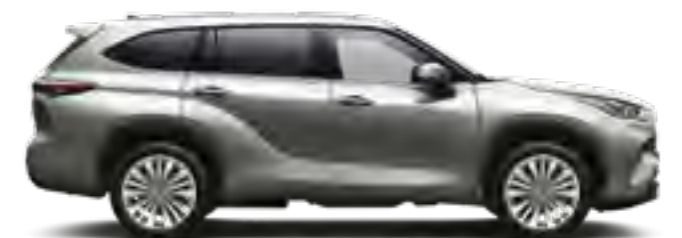
1J9 כסוף מטאלי