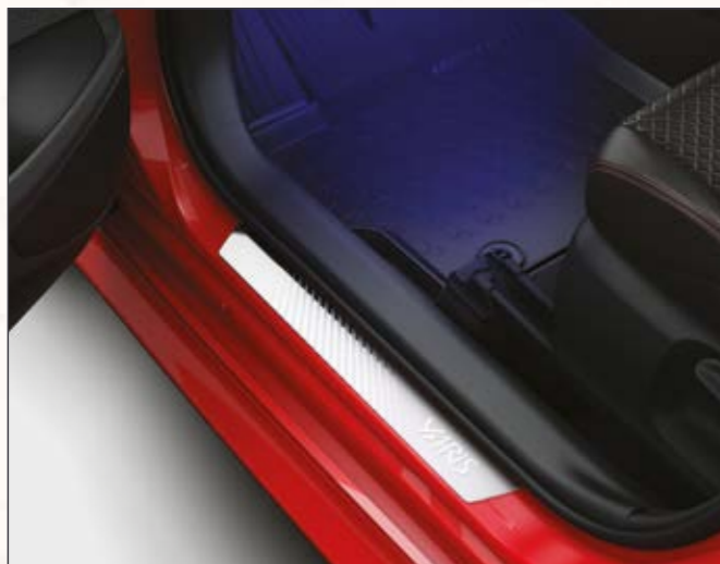
סט קישוטי סף קדמיים מקוריים היוצרים רושם מידי של סטייל, ובמקביל מגנים על סף הדלת מפני לכלוך ושריטות