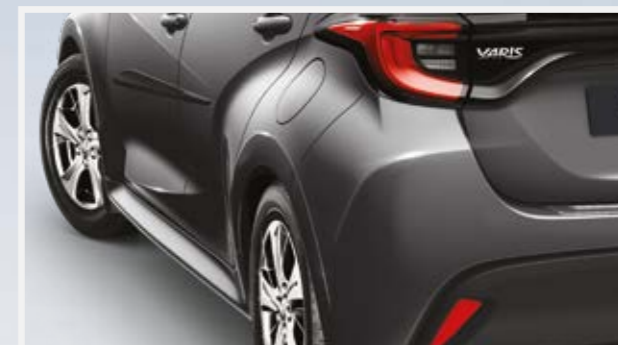
פסי הגנה לדלתות ואמבטיה לתא מטען המספקים הגנה מפני שריטות ופגיעות קוסמטיות