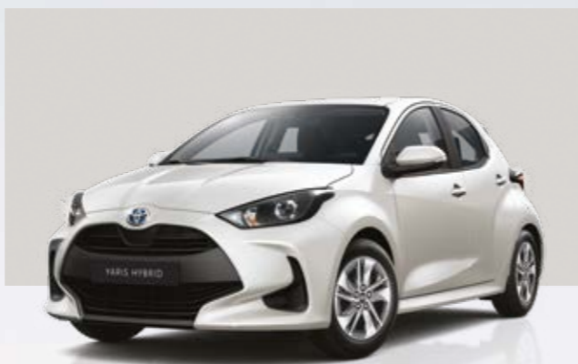
לבן פנינה מטאלי 089