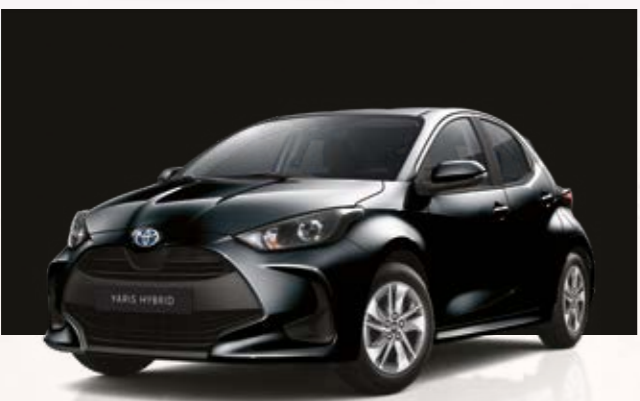
שחור מטאלי 209