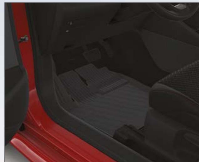
שטיחי גומי המגנים על פנים הרכב מפני לכלוך וניתנים להסרה ולניקוי פשוט