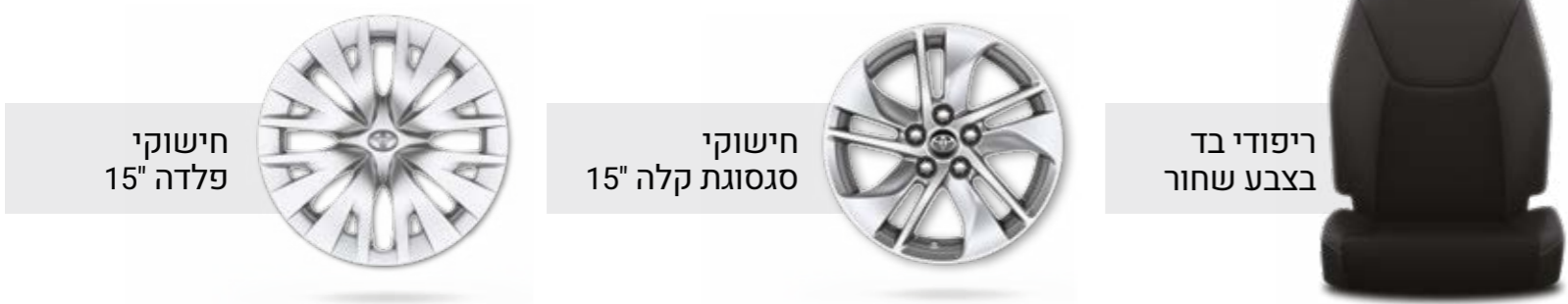
חישוקי פלדה 15"

*מומלץ לבדוק את תאימות הטלפון הנייד שברשותך למערכת ה-Bluetooth המותקנת ב-YARIS. את הבדיקה ניתן לעשות בלינק הבא: www.toyota-tech.eu/bluetooth/search.aspx **נכון למועד פרסום קטלוג זה, אפליקציית Android Auto אינה זמינה בישראל. ***פעילות ה-E-call תלויה ברשת הסלולרית הנמצאת בקרבת הרכב בעת שידור המידע.