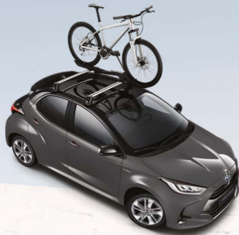
מוטות-רוחב, עבור מגוון אביזרי גג ומתקני אופניים