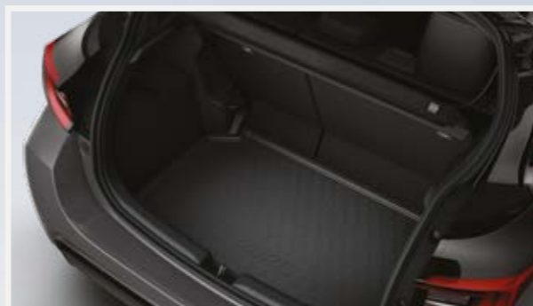
פסי הגנה לדלתות ואמבטיה לתא מטען המספקים הגנה מפני שריטות ופגיעות קוסמטיות