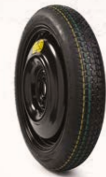
ערכת גלגל רזרבי וקומפקטי לניצול מקסימלי של נפח תא המטען