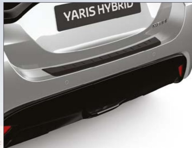
מגן פגוש אחורי המגן על הפגוש בעת טעינה ופריקה של סחורה מתא המטען