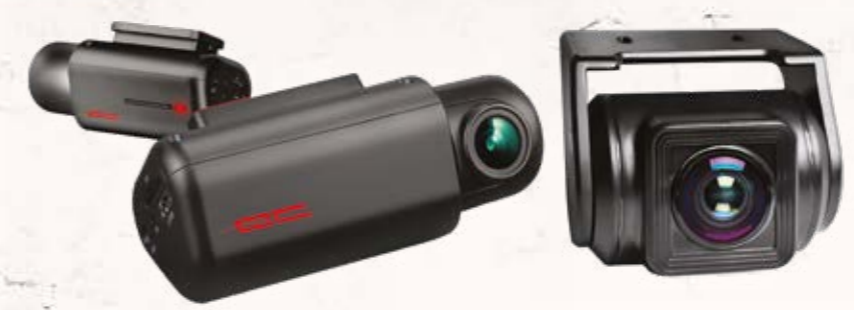
מצלמת DVR מצלמת דרך קדמית ואחורית מתעדת כל אירוע בכביש