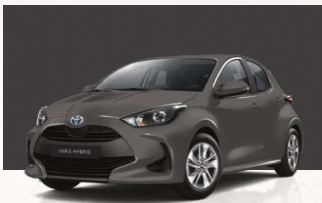
אפור מטאלי 1G3