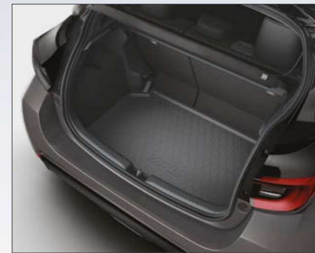
אמבטיה לתא המטען המספקת הגנה מפני לכלוך ומפני החלקה של ציוד וסחורה