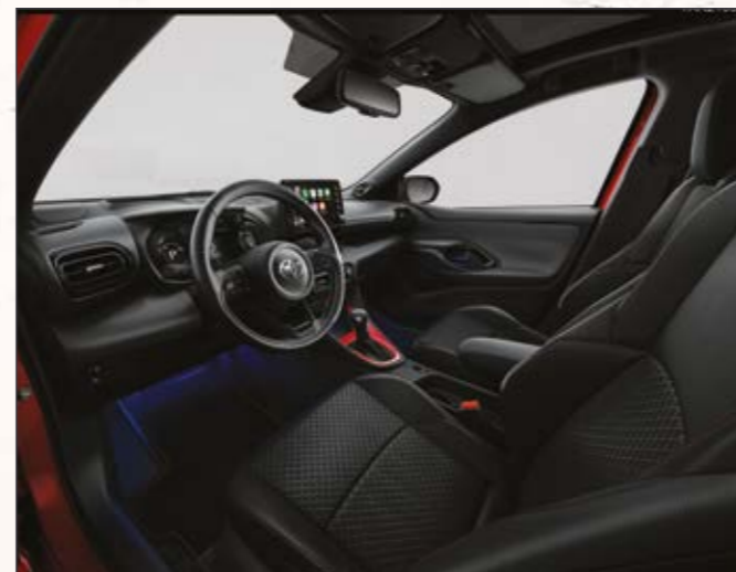
קישוט קונסולה מרכזית בצבע אדום שיהפוך את היאריס שלך לייחודית מבפנים כפי שהיא מבחוץ