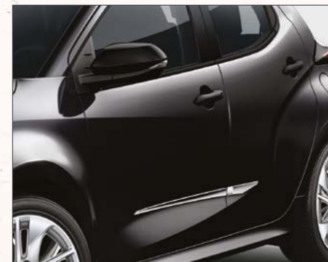
סט פסי קישוט בצבע כרום שייספקו ליאריס שלך מראה קלאסי בעל נגיעה אלגנטית