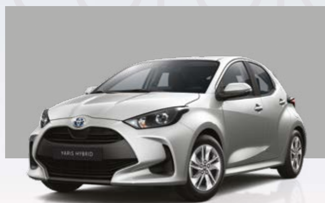
כסוף מטאלי 1L0