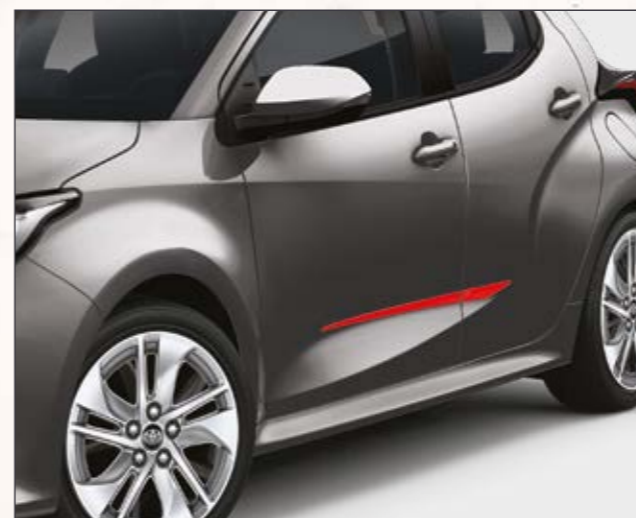
סט פסי קישוט בצבע אדום שיגרמו לראשים להסתובב בזכות נגיעת הצבע הנועזת שהם מוסיפים לרכב