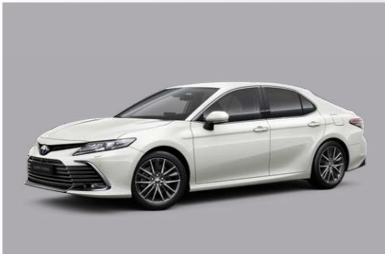
לבן פנינה מטאלי B-089