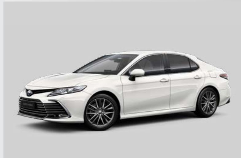
לבן צחור B-040