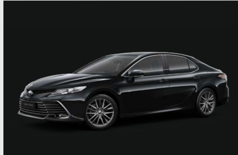
שחור מיקה מטאלי B-218