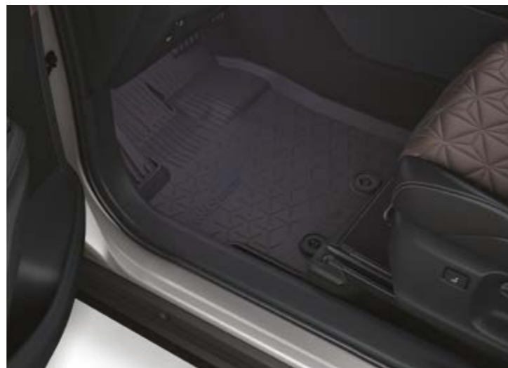
שטיחי גומי המגנים על פנים הרכב מפני לכלוך מבחוץ וניתנים להסרה לניקוי קל ופשוט