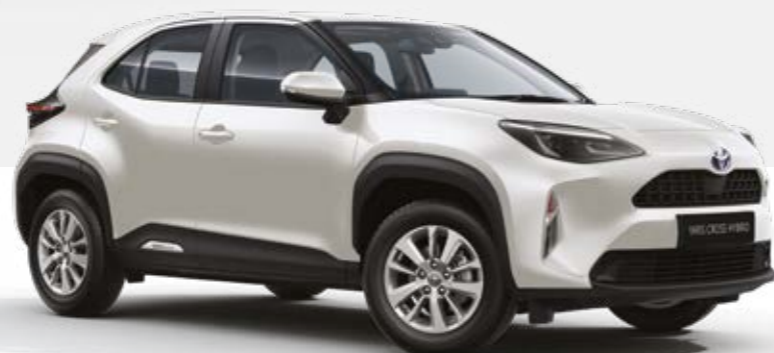
לבן פנינה מטאלי 089