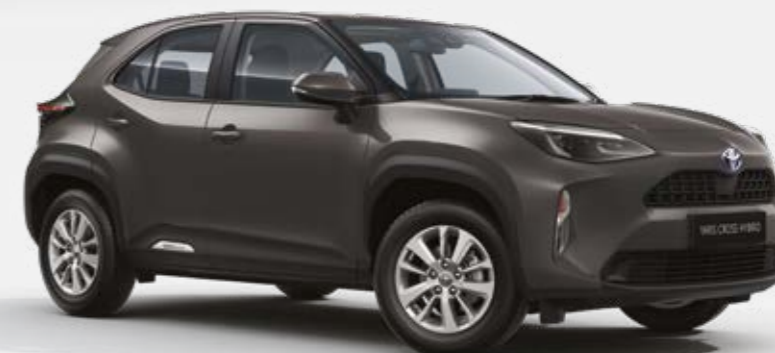
אפור כהה מטאלי 1G3