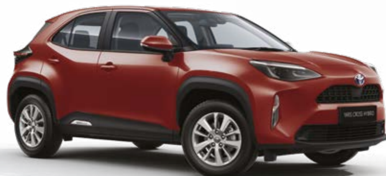
אדום מטאלי 3U5