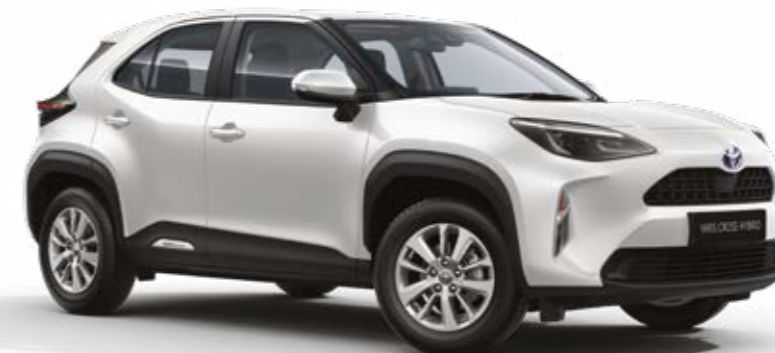
לבן צחור 040