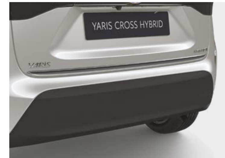
הוסיפו קישוט כרום המדגיש את עיצוב הפגוש האחורי ומבליט את המראה הייחודי של הרכב