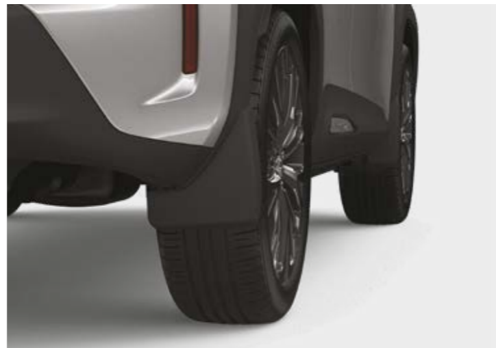
סט מגיני בוץ קדמיים ואחוריים, שיעזרו למזער כתמי מים ובוץ על הרכב