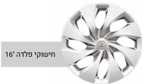
חישוקי פלדה 16"

*מומלץ לבדוק את תאימות הטלפון הנייד שברשותך למערכת ה-Bluetooth המותקנת ב-YARIS CROSS. את הבדיקה ניתן לעשות בלינק הבא: www.toyota-tech.eu/bluetooth/search.aspx **נכון למועד פרסום קטלוג זה, אפליקציית Android Auto אינה זמינה בישראל. ***פעילות ה-E-Call תלויה ברשת הסלולרית הנמצאת בקרבת הרכב בעת שידור המידע.