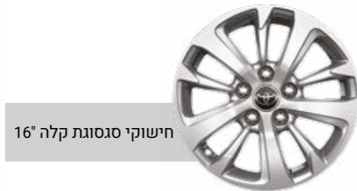
חישוקי סגסוגת קלה 16"