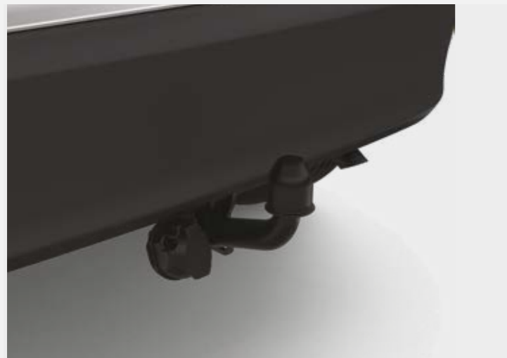
וו גרירה קבוע*