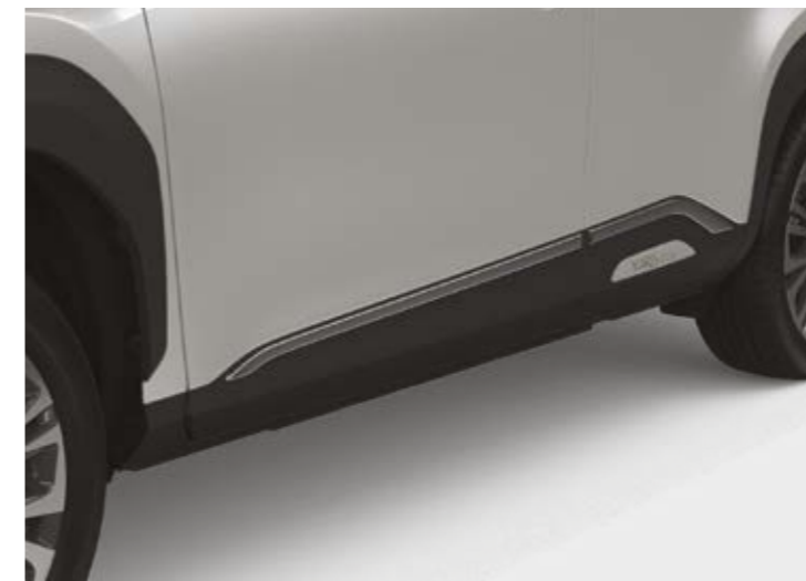
הוסיפו פס קישוט כרום לדלתות, והעניקו לרכב מראה עוצמתי לנגיעה נוספת של סטייל המותאם למראה של העיר