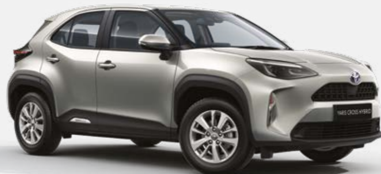
כסוף מטאלי 1L0 מטאלי