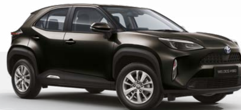
שחור מטאלי 209