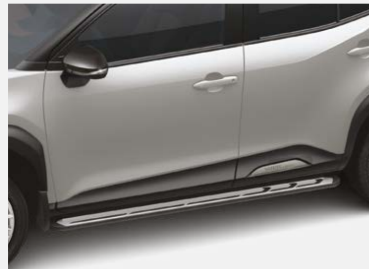
מדרגות צד המעצימות את המראה המחוספס של הרכב. שבנוסף מסייעות להגיע לגג הרכב בצורה קלה ופשוטה יותר