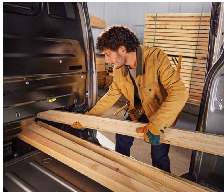
החלל המרווח והפונקציונלי של הרכב מאפשר לך להוביל חפצים ארוכים יותר