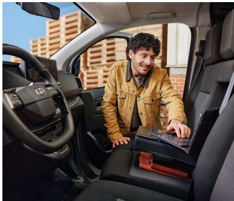
מסתכלים על התמונה הגדולה עם מושב שמתקפל והופך למשרד נייד ביום יום