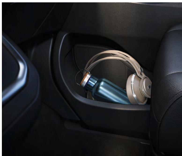
דואגים להשאיר את הדברים החשובים קרובים אליכם עם מגוון תאי אחסון