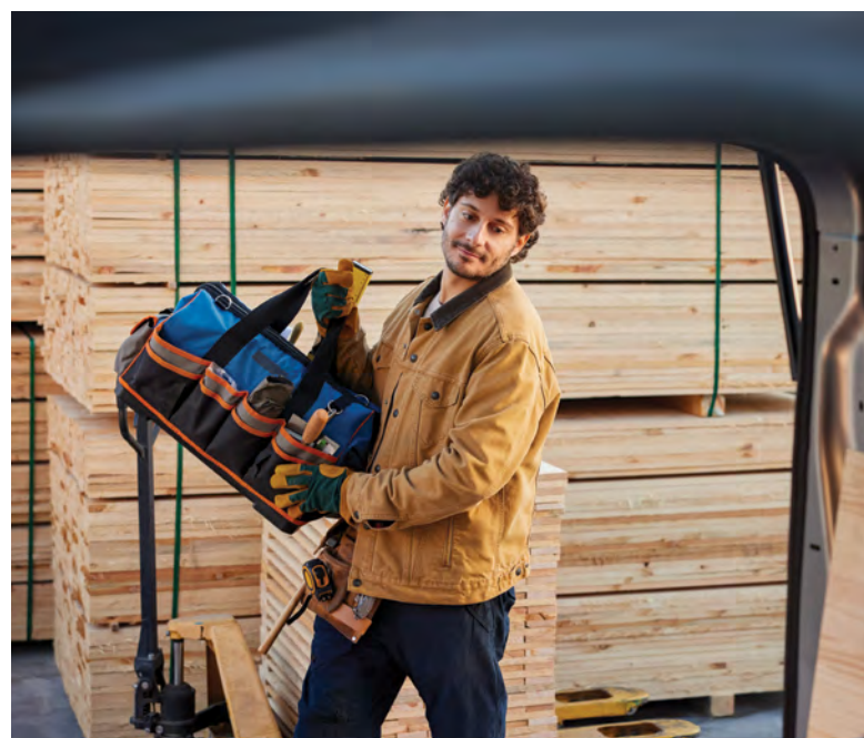
מנצלים את המרחב בצורה מיטבית