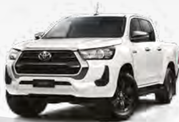
לבן צחור 040