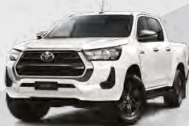
לבן פינה מטאלי 089