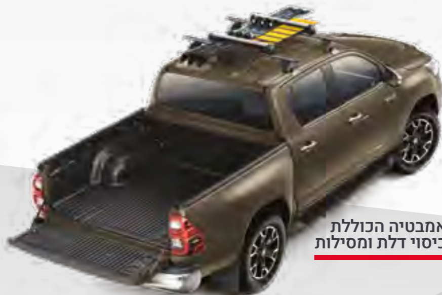
אמבטיה הכוללת כיסוי דלת ומסילות

אמבטיה לתא המטען, וו גרירה, קשת דקורטיבית ובולם שיכוך לדלת האחורית