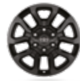
חישוקי סגסוגת קלה 18" בצבע שחור דגם SAHARA