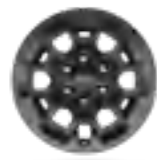
חישוקי סגסוגת קלה 17" בצבע שחור דגם GR SPORT

*מומלץ לבדוק את תאימות הטלפון הנייד שברשותך למערכת ה-Bluetooth המותקנת ב-Lexus, אשר הינה מסוג: Toyota Touch 2. ● קיים ○ לא קיים את הבדיקה ניתן לעשות בלינק הבא: www.toyota-tech.eu/bluetooth/search.aspx **נכון למועד פרסום קטלוג זה, אפליקציית Android Auto אינה זמינה בישראל.