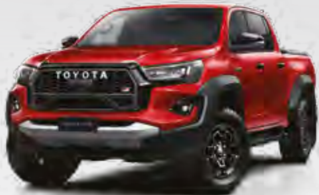
אדום עז 3U5**