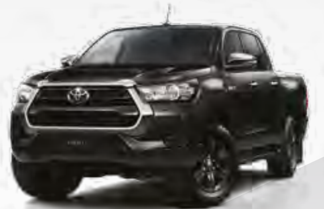
שחור מיקה מטאלי *218