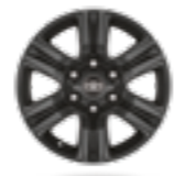
חישוקי סגסוגת קלה 17" בצבע שחור דגמי ACTIVE+, ADVENTURE