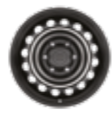
חישוקי פלדה 17" דגמי ACTIVE