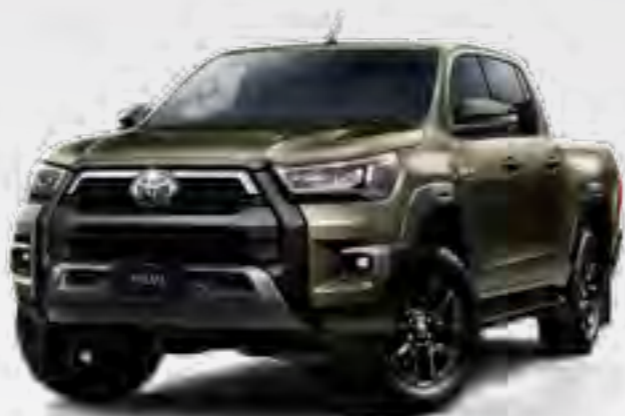
ברונזה מוזהב מטאלי 1X6*