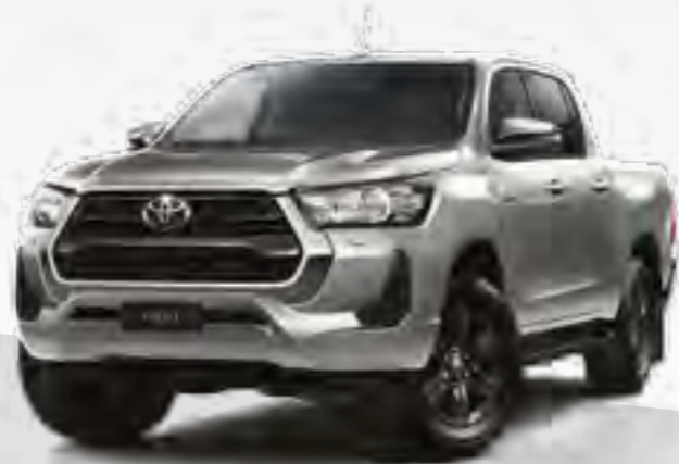
כסוף מטאלי 1D6