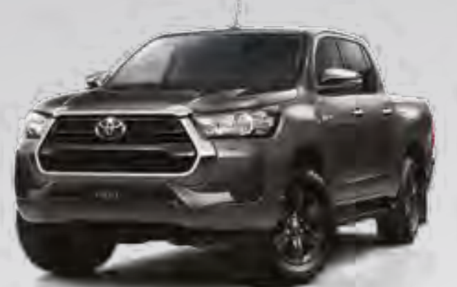
אפור כהה מטאלי 1G3