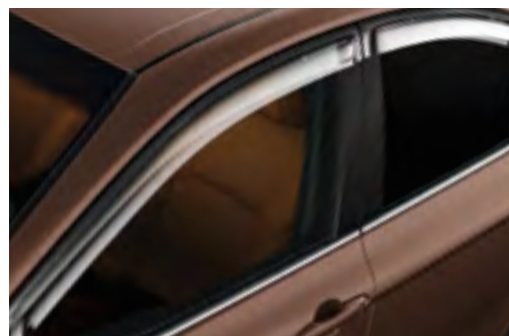
מגיני רוח מותאמים בצורה מושלמת לקאמרי ועשויים מחומרים עמידים. פתרון מושלם לרעשי רוח ושדרוג כללי לחוויית הנסיעה.