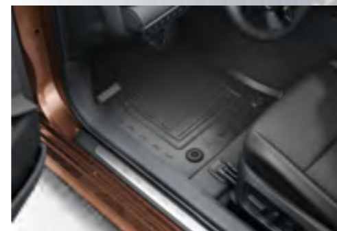
שטיחי גומי שטיחים עמידים וקלים לניקוי המותאמים למבנה הרכב ומתאימים לכל מזג אוויר. מיועדים לשמירה על רצפת רכב נקייה מפני לכלוך ונוזלים.