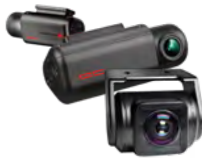
מצלמת DVR מצלמת דרך קדמית ואחורית מתעדת כל אירוע בכביש.