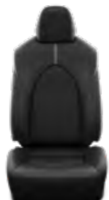
עור מלאכותי שחור מגיע ברמת גימור LE