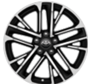
חישוקי סגסוגת קלה 18" ברמת גימור XLE