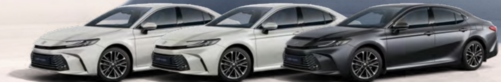
לבן צחור 040