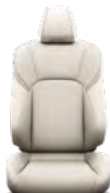
עור בהיר ריפוד עור בצבע בז', מגיע ברמת גימור XLE