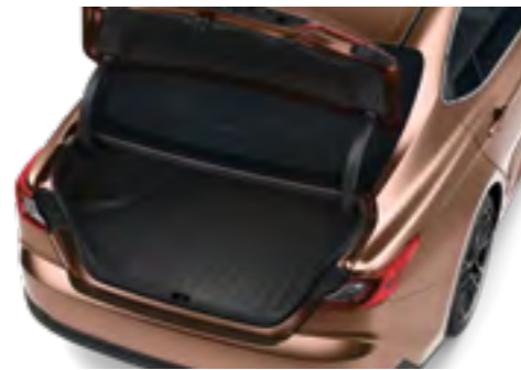
משטח הגנה לתא המטען משטח עמיד, קל לניקוי ומותאם בצורה מושלמת לרצפת תא המטען של הקאמרי לשמירה על תא מטען נקי מלכלוך.