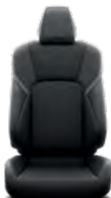
עור שחור ריפוד עור בצבע שחור, מגיע ברמת גימור XLE צבע חיצוני לבן צחור וכסוף מטאלי