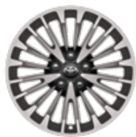
חישוקי סגסוגת קלה 17" ברמת גימור LE