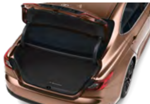
שטיח לבד יוקרתי לתא המטען שילוב מושלם של אלגנטיות והגנה. השטיח מגן על תא המטען מפני לכלוך ושריטות, עשוי מחומרים איכותיים ומותאם באופן מדויק למבנה הרכב, לשמירה על מראה נקי ומסודר.