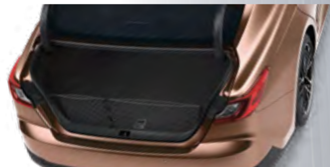
רשת לתא המטען הרשת מונעת תזוזת חפצים, עשויה מחומרים עמידים וגמישים, ומאפשרת שמירה על סדר ובטיחות בזמן הנסיעה.