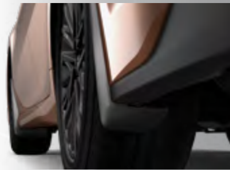
מגיני בוץ שמרו על הרכב שלכם נקי מפני לכלוך, אבק ומים לעמידות לאורך זמן.