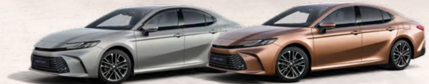
כסוף יוקרתי 1F7