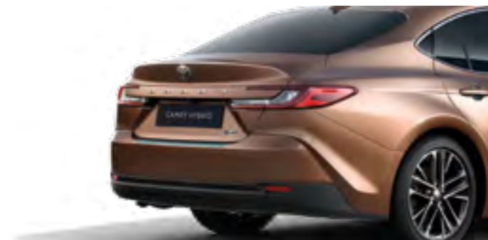
מגן פגוש אחורי מגן עמיד המיועד להגנה על הקאמרי באופן מושלם מפני שריטות וחבלות בזמן הטענת תא המטען ופריקתו.