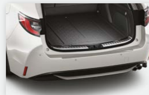
פס הגנה פגוש אחורי

PROTECTION PACK+ בתוספת חיישני חניה אחוריים - זמין ברמות גימור אקטיב ודינאמיק