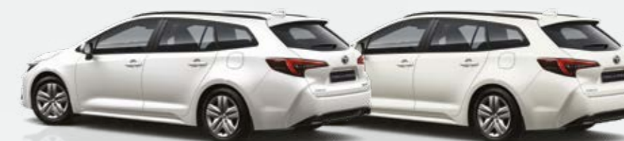
לבן פנינה מטאלי 089

*ממלך לבדוק את תאימות הטלפון הנייד שברשותך למערכת ה-Bluetooth המותקנת ב-COROLLA, אשר הינה מסוג Toyota Touch 2. את הבדיקה ניתן לעשות בלינק הבא: www.toyota-tech.eu/bluetooth/search.aspx . **נכון למועד פרסום קטלוג זה, אפליקציית Android Auto אינה זמינה בישראל. ***פעילות ה-E-Call תלויה ברשת הסלולרית הנמצאת בקרבת הרכב בעת שידור המידע