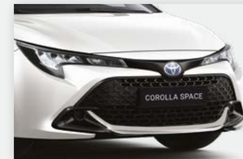
מגן פגוש קדמי שיגרום לרכב שלכם ולכם לבלוט בכביש בניקל, שחור או אדום