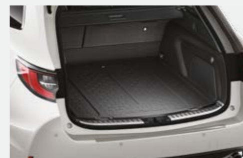
משטח הגנה לתא המטען המספק הגנה מפני לכלוך ומפני החלקה של ציוד וסחורה