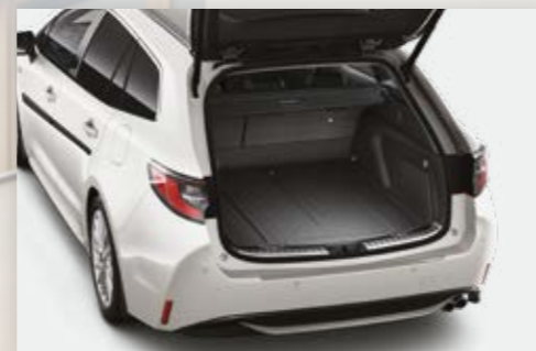
משטח הגנה לתא המטען