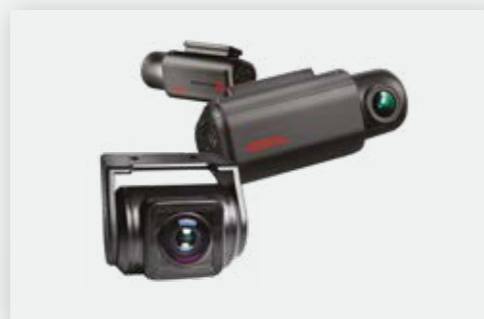
מצלמת DVR מצלמת דרך קדמית ואחורית מתעדת כל אירוע בכביש