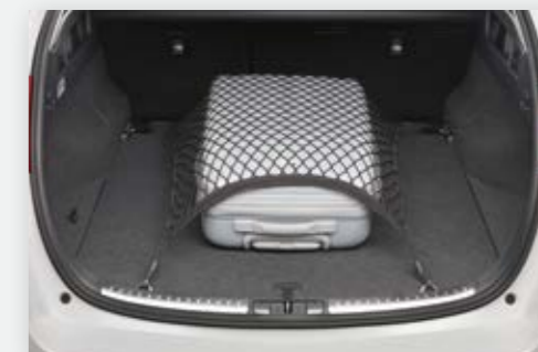
רשת המתחברת אל וויים בתא המטען ומספקת פתרון אידיאלי למניעת החלקה של תיקים ופריטים דומים בתא המטען