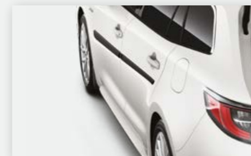
פסי הגנה לדלתות אשר יספקו הגנה מקיפה יותר לרכב שלך