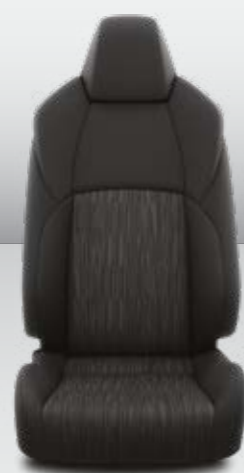
ריפוד בד שחור