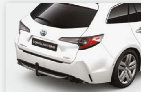
וו גרירה קבוע