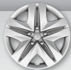
חישוקי פלדה 16" עם צלחות כיסוי מהודרות