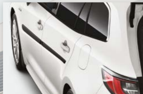
פסי הגנה שחורים לדלתות