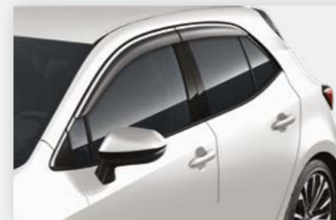
סט מגיני רוח