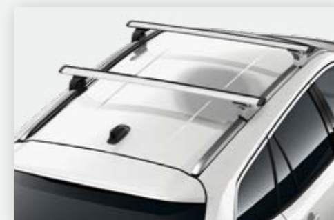
הוסיפו מוטות רוחב, עבור מגוון אביזרי גג ומתקני אופניים