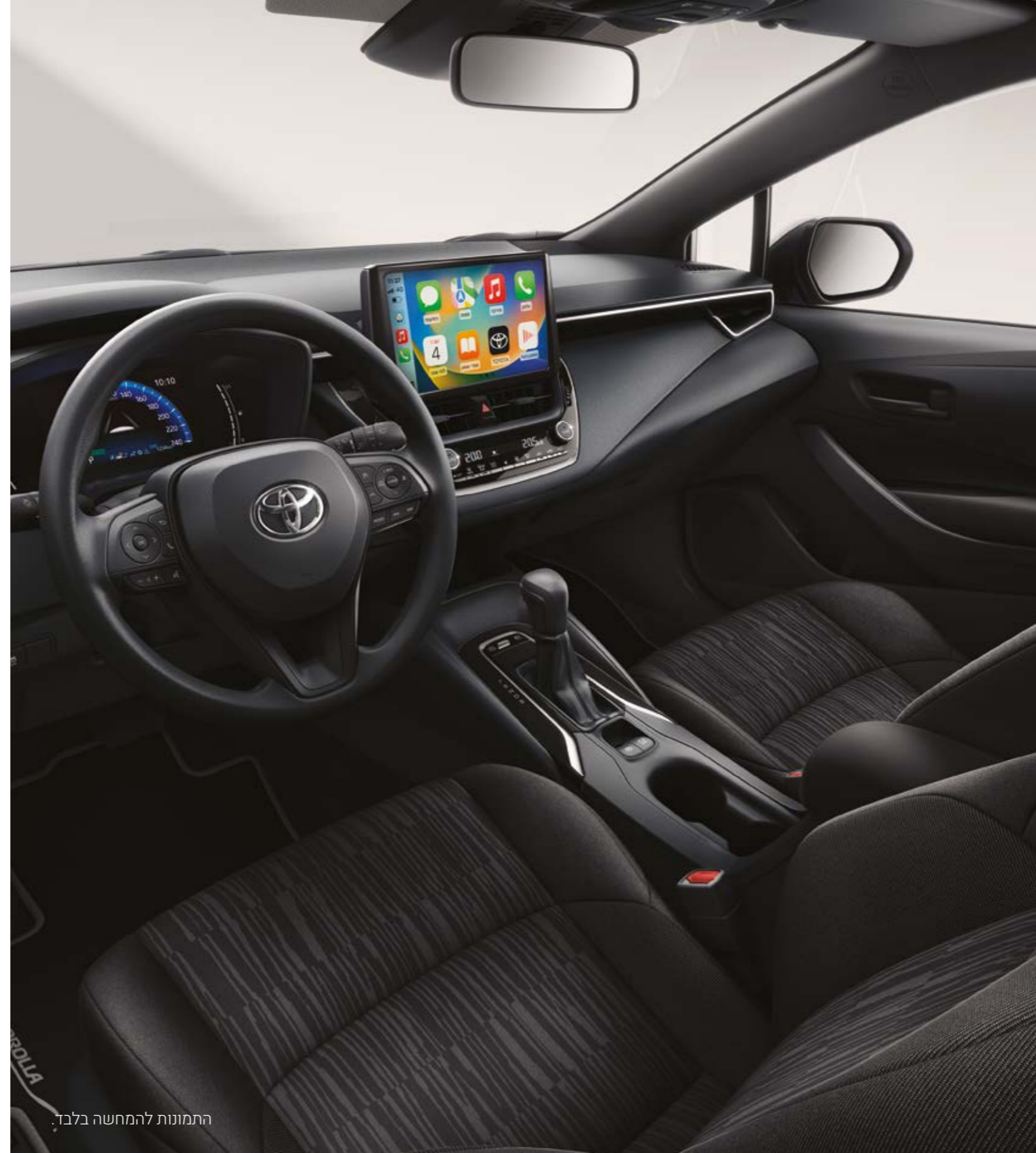
התמונות להמחשה בלבד.

*נכון למועד פרסום קטלוג זה, אפליקציית Android Auto אינה זמינה בישראל. **מומלץ לבדוק את תאימות הטלפון הנייד שברשותך למערכת ה-Bluetooth המותקנת ב-COROLLA, אשר הינה מסוג: Toyota Touch 2. את הבדיקה ניתן לעשות בלינק הבא: www.toyota-tech.eu/bluetooth/search.aspx