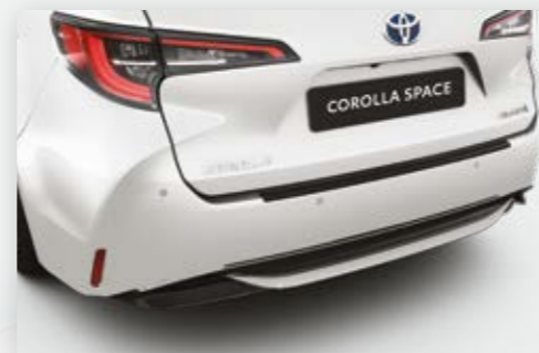
חיישני חניה אחוריים